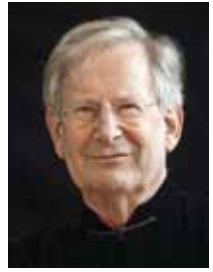
Sir John Eliot Gardiner